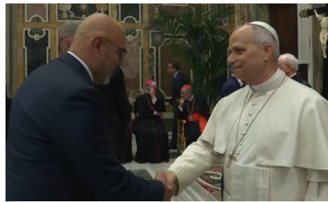
L'assessore regionale Sertori e Papa Leone XIV

SONDRIO (dns) Confartigianato Imprese Sondrio lancia un forte allarme sulla situazione sempre più critica del comparto dell'autotrasporto, sia merci sia persone, duramente colpito dall'impennata dei costi energetici e dei carburanti. «Il trasporto su gomma è un pilastro della nostra economia e della vita di tutti i giorni. Senza i nostri mezzi si fermano le imprese, ma soprattutto si ferma la quotidianità delle persone» dichiara Fausto Acquistapace , presidente del comparto Autotrasporto di Confartigianato Imprese Sondrio.