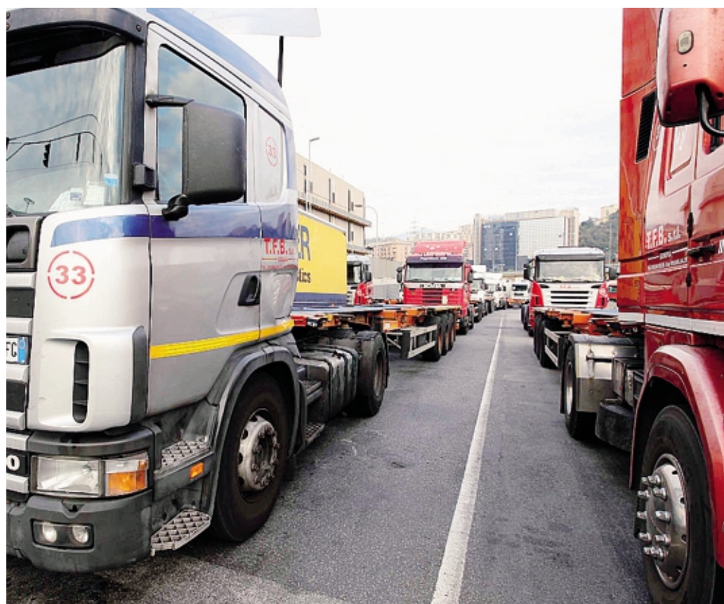
Le tensioni internazionali e lo choc energetico stanno determinando rincari straordinari