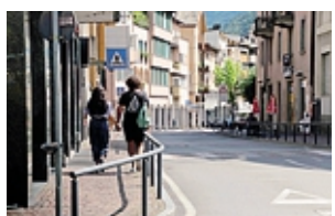
Via Vanoni a Morbegno

Il Comune valorizza le vie del centro città a Morbegno con l'attivazione del primo tratto del sistema di diffusione sonora urbana. GHELFI A PAGINA 31