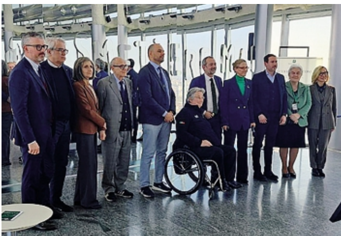
L'incontro per l'illustrazione del Bando per gli impianti sportivi

Risultati importanti dal Bando impianti sportivi 2025, la misura voluta per l'ammodernamento e la messa in sicurezza delle strutture lombarde dal sottosegretario alla presidenza della Regione Lombardia con delega a Sport e Giovani, Federica Picchi, e il sostegno del presidente Attilio Fontana.