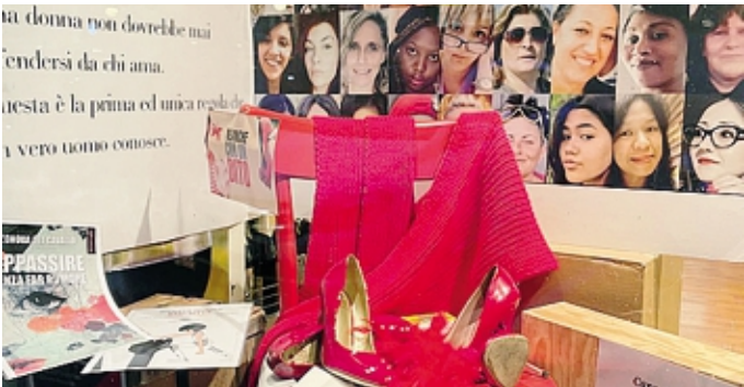
La promozione della campagna di Soroptimist Valchiavenna

La campagna Coinvolte in provincia scuole, saloni e palestre per l'iniziativa nazionale “Read the Sign”