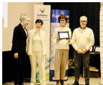
Gr Tendaggi Castione Andevenno