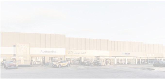
Si amplia la presenza di Autotorino nel Cremonese

Le quattro sedi di Autotorino - che raggiunge così quota 74 filiali a livello nazionale - offriranno un ventaglio di marchi particolarmente ampio. Accanto ai brand storicamente rappresen-