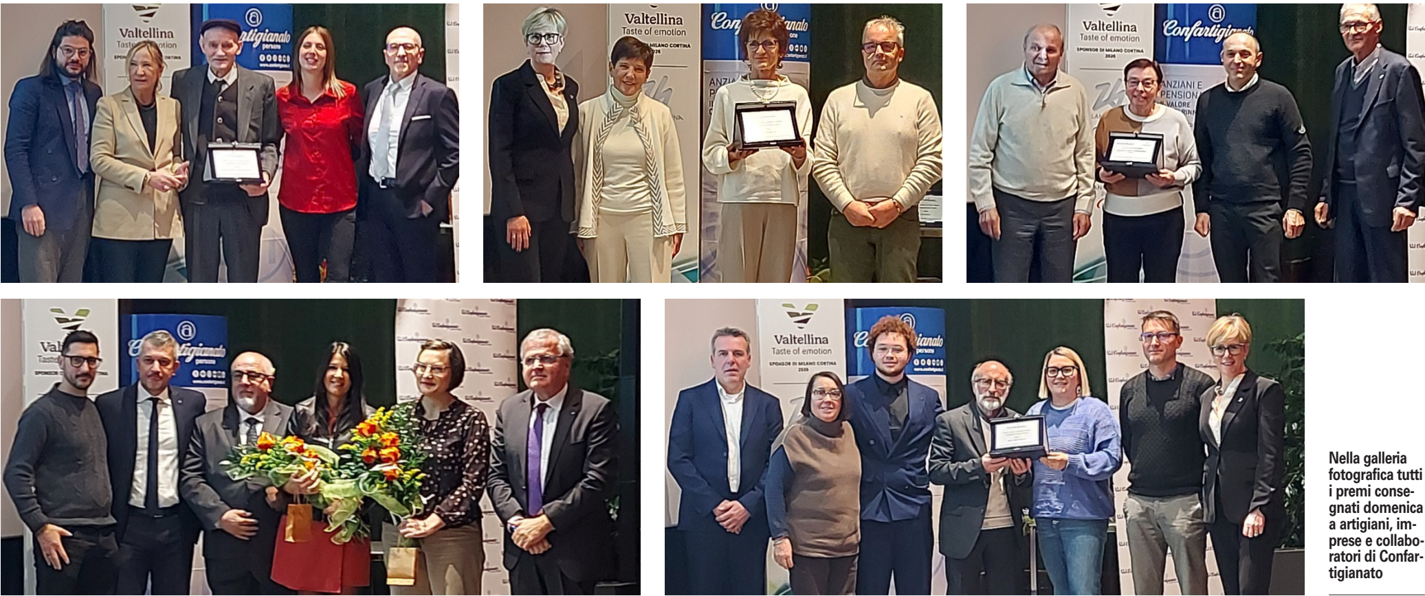
Nella galleria fotografica tutti i premi consegnati domenica a artigiani, imprese e collaboratori di Confartigianato