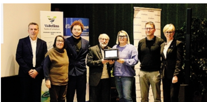
I premiati di Sosio Digital Point

E il suo motto «siamo nati pronti», declamato all'inizio del suo intervento quando si è parlato della Bormio pronta ad ospitare l'evento olimpico, è stato fatto proprio anche durante i numerosi interventi che