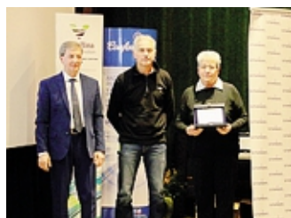
Carrozzeria Masotti di Tegglo