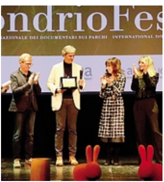
Ieri le premiazioni