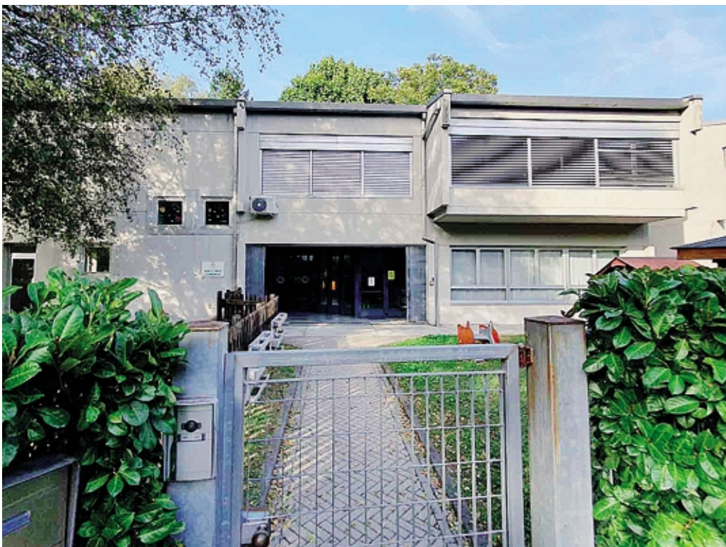
L'asilo nido comunale «La Coccinella» GIANATTI