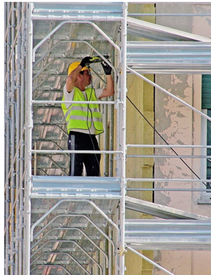
Cantiere a Sondrio in una foto d'archivio