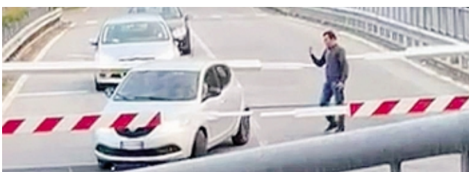
La vettura bloccata al passaggio a livello di Tresenda di Teglio

L'episodio raccontato da un uomo di Bormio anche sui social network e documentato con alcu-