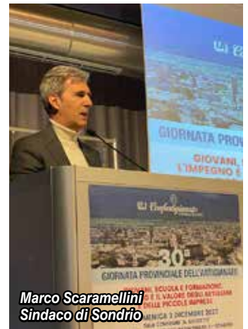
Marco Scaramellini Sindaco di Sondrio