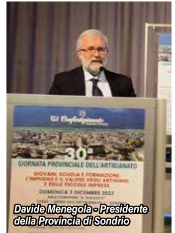
Davide Menegola - Presidente della Provincia di Sondrio

nuovo l'attenzione è stata dedicata ai giovani, alla formazione e all'importante ruolo formativo degli imprenditori artigiani.