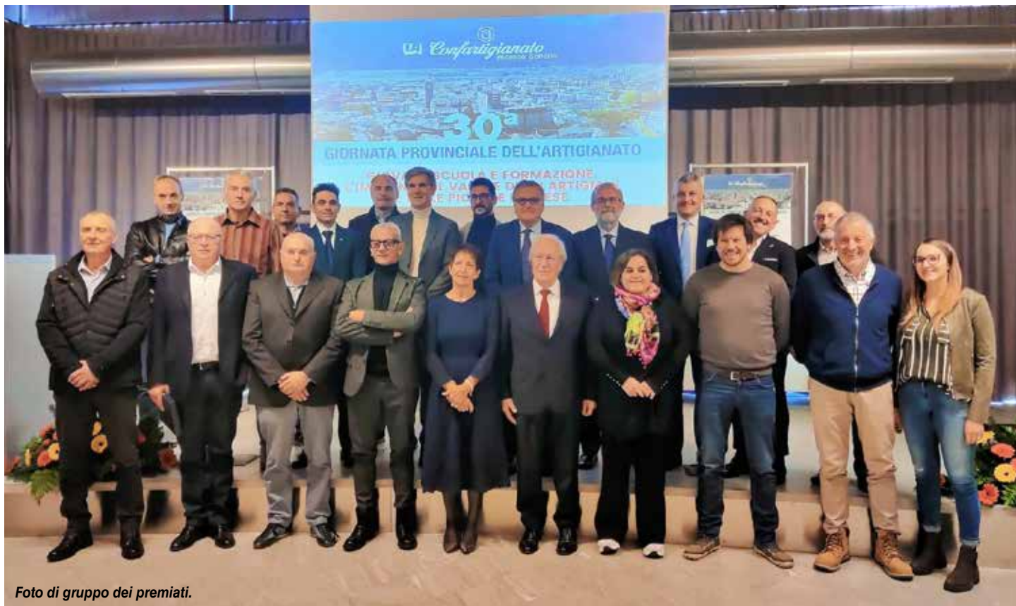
Foto di gruppo dei premiati.

Domenica 3 dicembre si è celebrata presso la sede di Sondrio dell'associazione la 30 a Giornata Provinciale dell'Artigianato. La tradizionale manifestazione, promossa e organizzata da Confartigianato Imprese Sondrio, ha visto una massiccia presenza di soci e di numerosi rappresentanti della società civile, amministrativa e