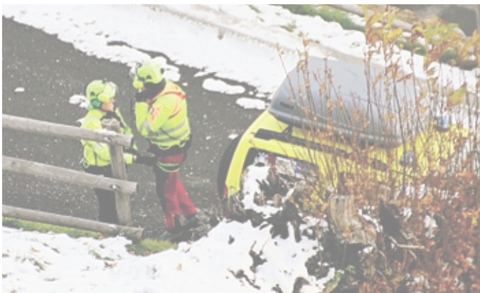
Il recupero dell'escursionista, di origini milanesi ma residente a Sirono

L'uomo, insieme ad alcuni conoscenti incontrati durante l'ascesa, stava percorrendo l'antica strada militare che sale da Pagnona, toccando anche il rifugio Griera. Si trovava poco sotto i 2.610 metri della vetta, quando è precipitato, in una zona particolarmente impervia, sul versante del monte che guarda verso i laghi