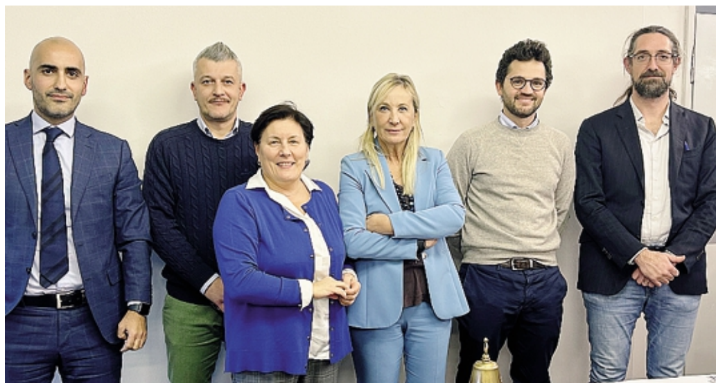
La presidente Loretta Credaro con la squadra della giunta camerale eletta di recente