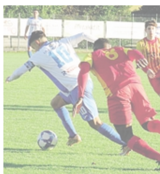
Busto ieri in azione