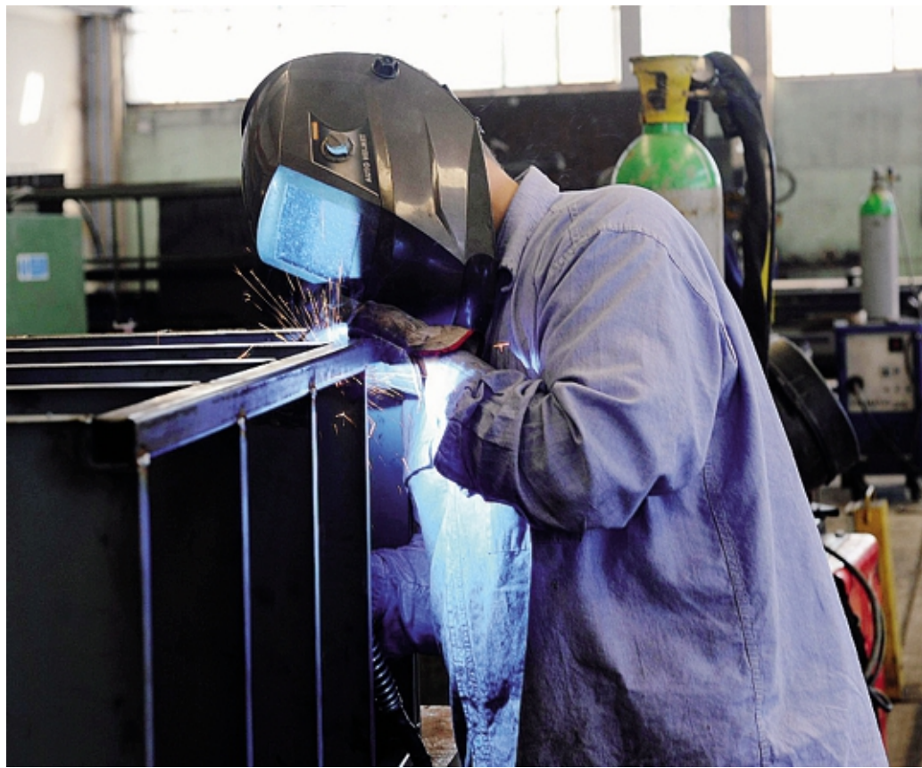
Produzione industriale in calo e più intensamente rispetto alla media regionale