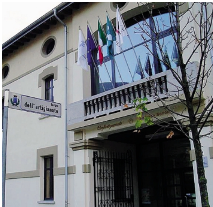
L'appuntamento è alle 10,30 nella sala Succetti

L'appuntamento è alle 10,30 nella sala Succetti di Confartigianato. L'evento di carattere associativo, nato per celebrare i valori dell'artigianato e della