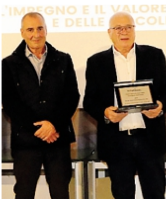
Riconoscimento all'azienda Pini