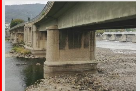
Un'immagine emblematica dell'Adda in secca

Situazione drammatica, scatta l'intervento Crisi idrica, un piano per riempire i bacini