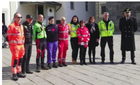
A PAGINA 10 I protagonisti della cerimonia di domenica a Sondrio

La ricorrenza ricordata a Sondrio I primi trent'anni del 118, la festa di chi salva le vite