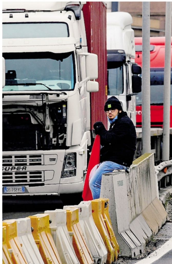
Coinvolta nell'iniziativa anche l'autoscuola San Giorgio di Sondrio

■ L'iniziativa conta sul supporto dei Centri per l'impiego provinciali