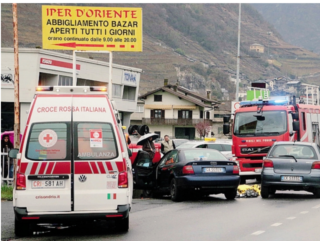
La tragica scena del frontale avvenuto ieri pomeriggio a Villa di Tirano, sulla statale 38